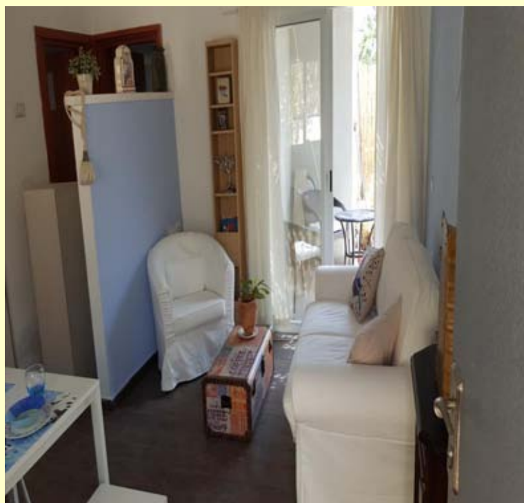
Appartement van ons gastenhuis Nof Shomron