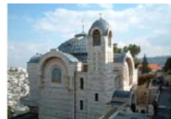
Church of Saint Peter's in Gallicantu

Op de kuierlatten door Yerushalayim. En er valt veel te kuieren als we langs de plaatsen gaan, waar Jezus de laatste dagen voor Zijn sterven verbleef. Te beginnen bij de Olijfberg. De tuin van de Hof van Getsemané. Het Kidrondal tussen de Olijfberg en de Tempelberg. Dan naar het huis van Kajafas. Dat is lopend het gemakkelijkst te bereiken vanaf de Sionspoort, of met de taxi naar deze R.K-kerk, waar niet alleen een kruis op staat, maar ook een haan, ter herinnering aan de verloochening. Deze kerk is op de fundamenten van het huis van Kajafas gebouwd in het Hinomdal aan de weg welke Malchizedek heet en waar de kerker helemaal onderin nog intact en te bezoeken is. Zeer indrukwekkend.