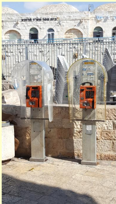
‘Antiek’ in de Antieke Stad....