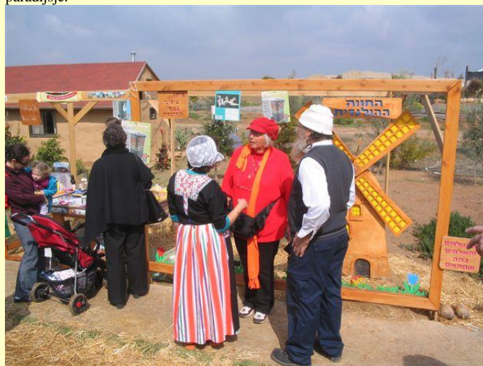
Foto van de eerste braderie uit 2008... Toen nog zo kaal maar nu een klein groen paradijsje.

Bent u in de periode van eind januari-eind februari even in Israel en heeft u zin om bv. poffertjes, kaas, patat of koffie te verkopen en een (half) dagje mee te draaien op de braderie van de DutchFarm in moshav Sde Zvi? Welkom, ook gewoon even voor een bezoekje! Iedere vrijdag vanaf 27 januari van 9.00-15.30u. is er gelegenheid om vele Israëliërs te ontmoeten, die jaarlijks op de creatieve en 'smakelijke' Nederlandse Braderie afkomen (met een echt draaiorgel...) en kunt u tegelijk het mooie zuiden bezoeken met de honderdduizenden anemonen die daar dan bloeien. Geïnteresseerd? Neem even contact op: nr. 00972 54 8858281 Yair of Karen Strijker