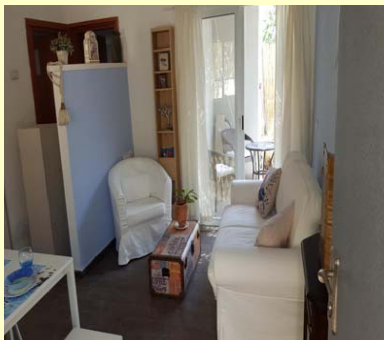
Appartement van ons gastenhuis Nof Shomron