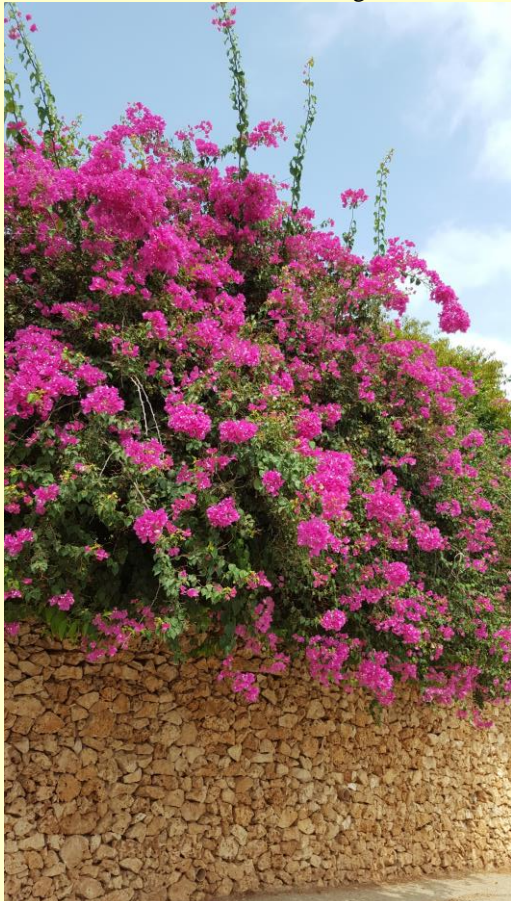
Antwoord: een paraceta-mol....

Overal in Israël bloeit nu de Bougainvillea