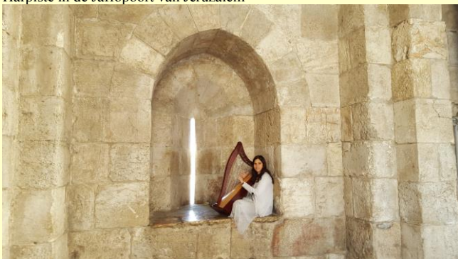
Harpiste in de Jaffopoort van Jeruzalem

TijdStip nr. 27 is uit! Wilt u een proefnummer of direct een abonnement? Mail ons dan.