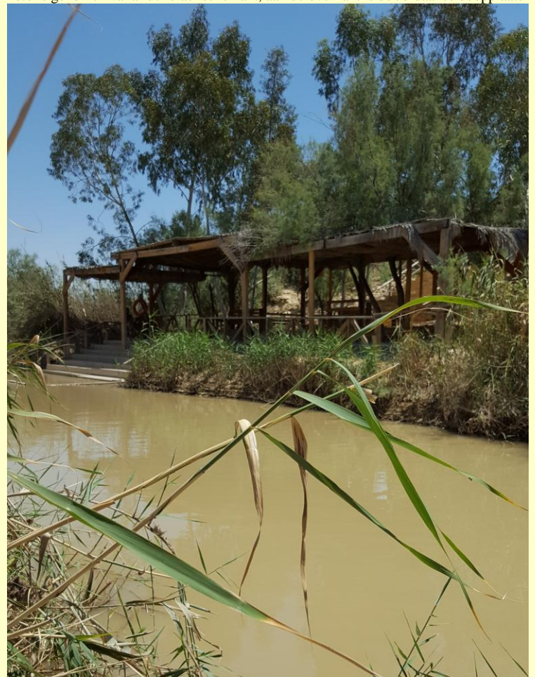
Foto is genomen vanaf de Israelische kant, aan de overkant is de Jordaanse doopplaats