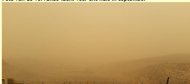
Foto van de vervuilde lucht voor ons huis in september

Helaas... ook in de Knesset zitten 'bad boys' en hoe kom je ervan af? Deze week stonden de kranten, naast de berichtgeving over de aanhoudende steekpartijen, er vol van... Er zijn twee Knessetleden van de coalitie die wegens slecht gedrag over de tong gaan. Eén van hen, Yinon Magal, voorzitter van Beit Yehudi, trad af, wegens seksuele intimidatie in het verleden naar enkele vrouwen. De ander, Oren Hazan (Likud), waar wij al eerder over geschreven hebben, een man met o.a. een vermeend gokhuis in Bulgarije, zit nog op zijn plaats, maar hem hangt gevangenisstraf boven het hoofd. Het is allemaal wat lastig, ook omdat zijn familie nogal invloed heeft in de Likud....en...omdat Netanyahu maar een erg krappe meerderheid heeft... maar toch AJB Bibi: "Zuiver de boel en de vuile lucht..."