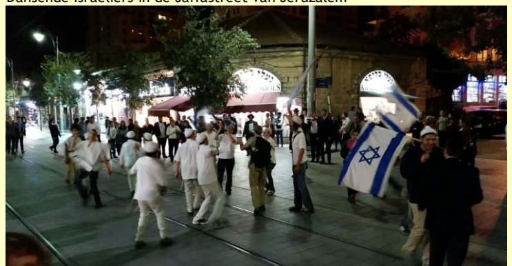
Dansende Israëliërs in de Jaffastreet van Jeruzalem

Deze week viel het 23ste slachtoffer aan Israëliërs zijde. Onder hen tellen we ook twee Arabische Israëliërs die, zoals hun achterban dat zegt, op de verkeerde tijd op de verkeerde plek waren... Ook die Arabisch-Israëliërs worden Israel nota bene in de schoenen geschoven door Abbas/Fatah. Hamas verkondigde dat het doden van Israëliërs geen terreurdaad is. Wij (Israëliërs) zijn 'bezettters' en we moeten eruit volgens hen. Het omgekeerde is het geval: zij zijn de krakers, ze hebben nooit een Palestijnse staat gesticht toen het eeuwenlang kon, het land lag eeuwenlang in de vernieling en de huidige Israëliërs hebben voor 80% voorouders uit andere landen en bij vredesbesprekingen haken zij op het laatste moment steeds af en komen met nieuwe eisen. Er zijn nog veel meer punten te noemen maar als je 'tegen Israel' bent dan heb je blijkbaar geen oor en oog voor deze punten, het lijkt wel een 'scheiding van geesten'. We bidden voor de vrede van Jeruzalem en shalom voor Israel en haar behoud want zonder Israel zal er nooit vrede op aarde komen.