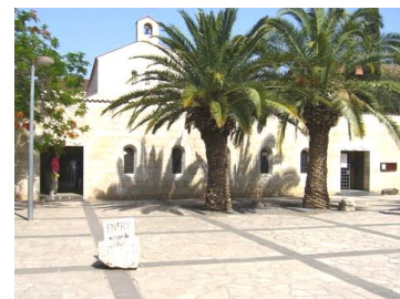
Bread and Fish Church

Daar heeft Hij nog meer wonderen verricht, zoals de spijziging van de vijfduizend mannen, vrouwen en kinderen niet meegerekend, in Mattheüs 14 vanaf vers 13. Die plaats aan de oever van het meer kennen we nu als Tabgha, waar de Brood- en Viskerk staat en waar Jezus uit vijf broden en twee vissen al die mensen zoveel te eten kon geven. Vijf broden en twee vissen, dat is bij elkaar zeven, het getal van de volheid. Die menigte had daarvan voldoende gegeten en er bleven 12 manden vol met stukken brood over.